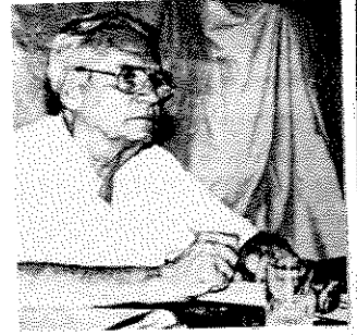
I sa strane u izveštajima zajednica u Banjaluci i Dobroju

Dana 16. jula u pibštinama Saveza u Beogradu održana je 34. redovna Konferencija opština. Sastanku su prisustvovali predstavnici svih opština, članovi Izvršnog odbora Saveza, stručni saradnici, predsednik i počasni predsednik Saveza, i gosti. Posle usudnih napomena i dogovora u radu Konferencije (formirano je radno predsedništvo na čelu s Mirkom Vagočelidom, imenovane verifikaciona i kandidaciono-izborna komisija, imenovani zapisničar i overači zapisnika i uticalo jeeno da od moguca 32 delegata, Konferencija prisustvuje 25, čime je obezbeđen kvorum za mesetani rad), posle čitanja pozdrava i želja za uspešan rad okupa i trenutno stanje kojim je odabrana Žrtvina rata i prenamolno članovima izvedu dve konferencije, predsednik David Albahari podneo je izvешtaj o radu Saveza za protekli godinu. Iz izvешtaja se moglo saznati šta se sve dešavalo na planu redovnih aktivnosti zajednice, s kim se i na